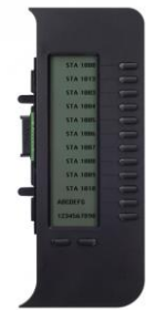
+12/12 flexknappar med display till LIP-9020 och LIP-9030. ( www.licencia.se/20-80127-0 )