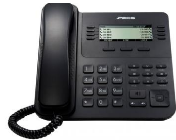
LIP-9030.STGBK ( www.licencia.se/20-80123-0 )