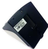
Väggfäste till LIP-9002. ( www.licencia.se/20-80128-0 )