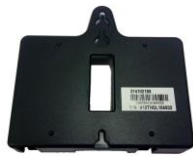
Väggfäste till LIP-9020 och LIP-9030. ( www.licencia.se/20-80129-0 )