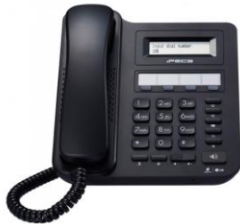
LIP-9002.STGBK ( www.licencia.se/20-80120-0 )