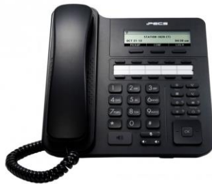
LIP-9020.STGBK ( www.licencia.se/20-80122-0 )